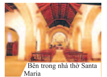
Bên trong nhà thờ Santa Maria