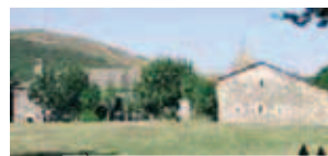
Đền thánh O'ebreiro