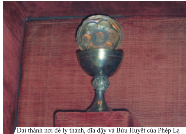
Đài thánh nơi để ly thánh, đĩa đựng và Bửu Huyết của Phép Lạ

Phép lạ Thánh Thể O'ebreiro xảy ra trong Thánh Lễ, khi Bánh Thánh biến thành Thịt, và rượu trở thành Máu tuôn tràn dính vào khăn thánh. Chúa đã làm phép lạ này để tăng cường đức tin của một linh mục không tin vào sự Hiện Diện Thực Sự của Chúa Giêsu trong Thánh Thể. Cho đến ngày nay, Thánh tích còn được gìn giữ gần nhà thờ nơi Phép Lạ xảy ra, được các tín hữu hành hương kính viếng hàng năm.