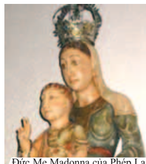
Đức Mẹ Madonna của Phép Lạ