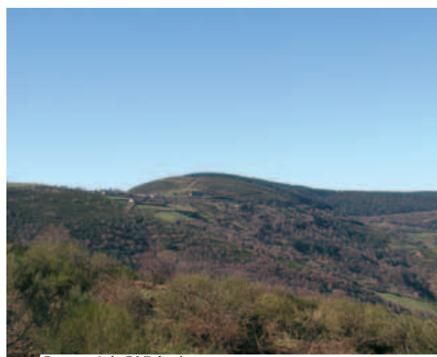
Quang cảnh O'ebreiro