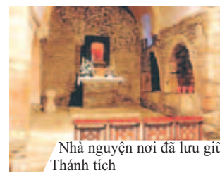
Nhà nguyện nơi đã lưu giữ Thánh tích