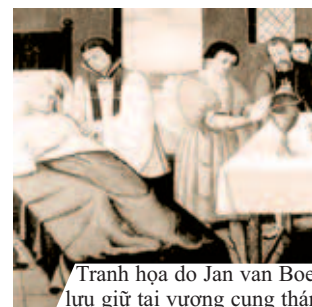
Tranh họa do Jan van Boeckhorst diễn tả cảnh tượng Phép lạ, lưu giữ tại vương cung thánh đường Hasselt