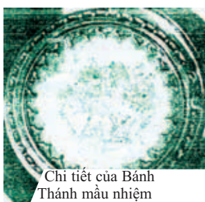
Chi tiết của Bánh Thánh màu nhiệm