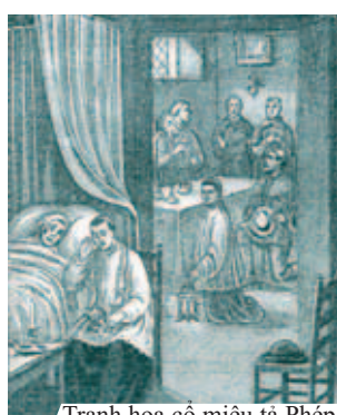
Tranh họa cổ miêu tả Phép lạ