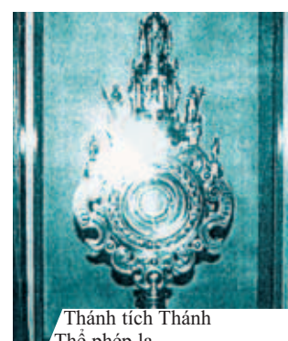
Thánh tích Thánh Thể phép lạ

N gày 25 tháng 7 năm 1317, cha sở Viversel được mời đem Mình Thánh đến cho một giáo dân nằm bệnh tại nhà đã lâu và đang hấp hối. Sau khi đến nhà người bệnh, cha để túi xách có Thánh Thể lên bàn, và đến bên giường người bệnh để nghe xưng tội. Trong khi ấy, một người nhà của bệnh nhân đã tò mò lục trong túi xách của cha để trên bàn, không hề biết là trong bao đó có đựng vật gì. Người này lấy ra chiếc túi nhỏ có hộp pyx đang đựng Thánh Thể, mở túi ra xem, và còn cho tay vào bên trong. Khi biết có Thánh Thể bên trong hộp, anh ta để tất cả lại như cũ. Vừa lúc ấy, cha sở ra khỏi phòng bệnh nhân sau khi nghe xưng tội. Cha mở hộp pyx ra, thấy Thánh Thể chính cha đã thánh hiến khi làm Lễ đang chảy Máu, và bị dính vào miếng vải lót trong hộp pyx. Cha kinh ngạc sững sờ, nghĩ rằng có lẽ vì cha đã phạm một lỗi