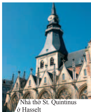
Nhà thờ St. Quintinus ở Hasselt