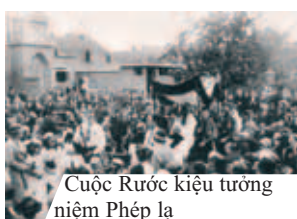
Cuộc Rước kiệu tưởng niệm Phép lạ