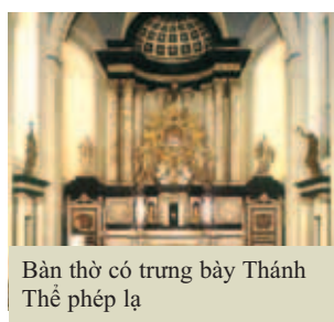
Bàn thờ có trưng bày Thánh Thể phép lạ