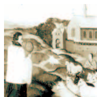
Tranh họa lưu giữ ở vương cung thánh đường Hasselt, cảnh các súc vật đang quỳ khi linh mục rước Thánh Thể đi ngang Sacramentberg.