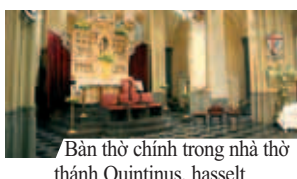
Bàn thờ chính trong nhà thờ thánh Quintinus, hasselt