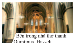
Bên trong nhà thờ thánh Quintinus, Hasselt