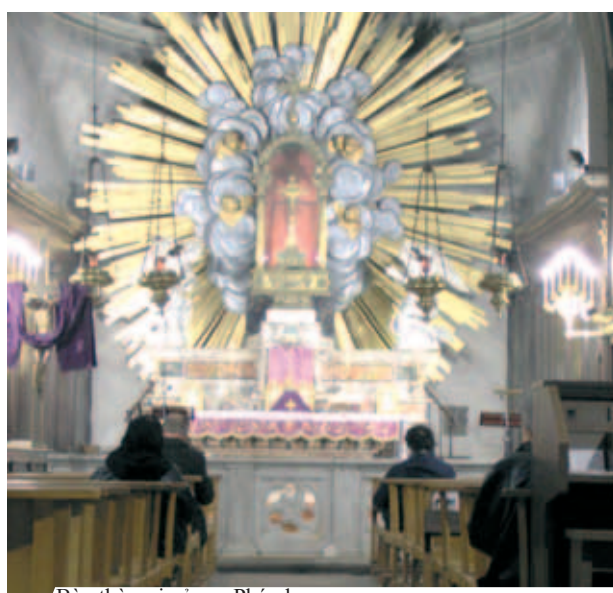
Bàn thờ nơi xảy ra Phép lạ