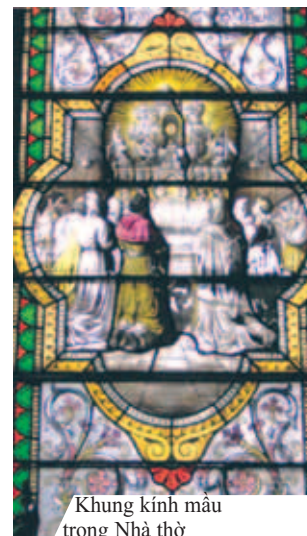
Khung kính màu trong Nhà thờ