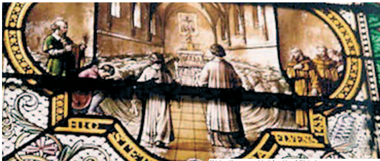
Kính màu trong nhà thờ miêu tả Phép lạ

Ngày 30 tháng 11, 1433, các tu sĩ Penitents Xám thuộc Dòng Phanxicô đem trưng bày Thánh Thể trong giờ Chầu phép lành 24 tiếng cho mọi người chiêm ngắm. Sau nhiều ngày mưa tầm tã, nước sông dâng tràn làm Avignon bị lụt lội. Hai tu sĩ dùng chèo thuyền nhỏ ra nhà thờ nơi Thánh Thể còn đang được bày ra. Khi đến nhà thờ, họ thấy nước rẽ ra hai phía trái và phải, không chạm đến bàn thờ và Thánh Thể Cực Trọng vẫn còn khô ráo không bị ướt.