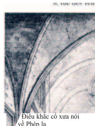
Điêu khắc cổ xưa nói về Phép lạ