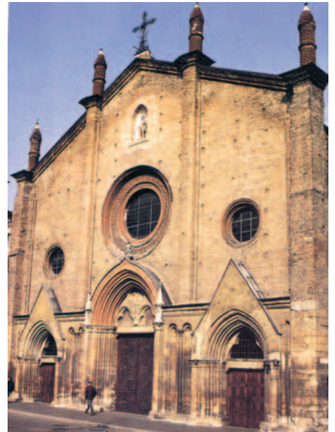
Nhà thờ viện thần học San Secondo ở Asti