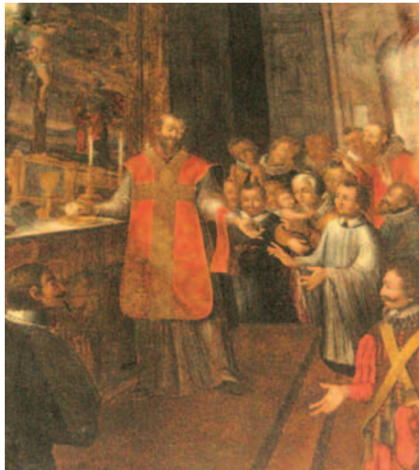
Tranh dầu trên canvas (tác giả vô danh, thế kỷ 17) diễn tả Phép lạ Thánh Thể ở nhà thờ San Secondo năm 1535, đang giữ trong nhà nguyện