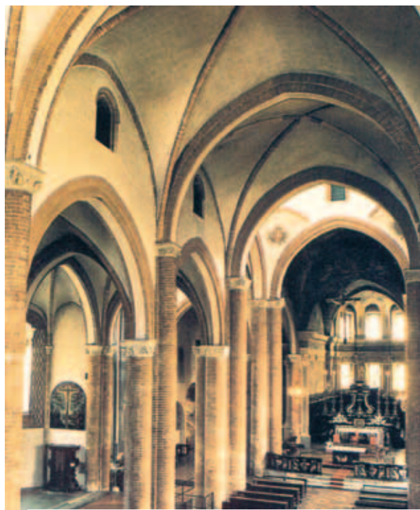
Bên trong nhà thờ San Secondo