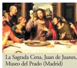
La Sagrada Cena, Juan de Juanes, Museo del Prado (Madrid)