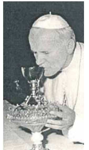
Juan Pablo II besa el Santo Graal de Valencia