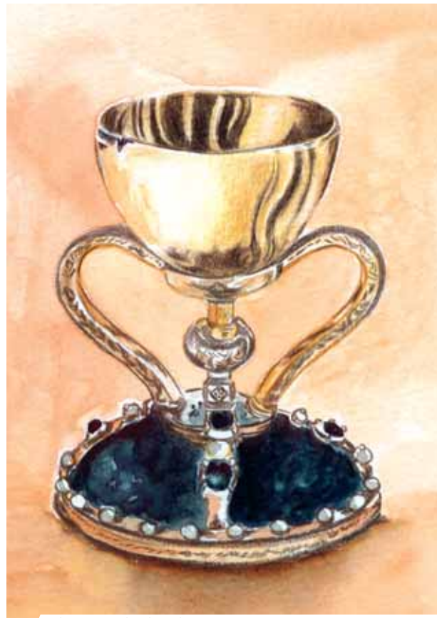
El Santo Cáliz de Valencia

En el siglo XX las novelas de ficción, escritas por B. Cornwell, favorecieron el nacimiento de una corriente editorial que dura hasta hoy.