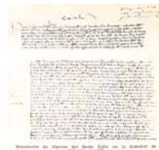
Documento de ingreso a la Catedral del Santo Cáliz en 1437