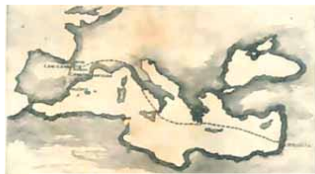
Recorrido realizado por el Santo Cáliz