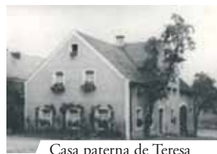
Casa paterna de Teresa