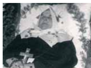
Teresa muere en Konnersreuth en 1962