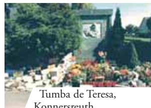
Tumba de Teresa, Konnersreuth