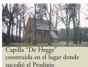
Capilla "De Hegge" construida en el lugar donde sucedió el Prodigio