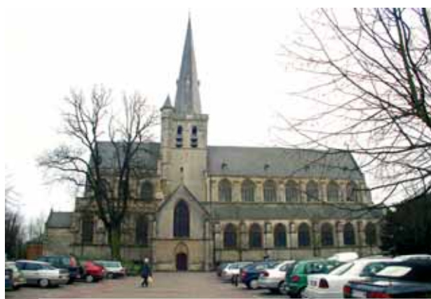
Iglesia de San-Waldetrudis, Herentals