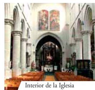
Interior de la Iglesia di San-Waldetrudis