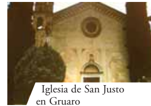
Iglesia de San Justo en Gruario