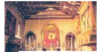
Interior de la Iglesia del SS. Cuerpo de Cristo