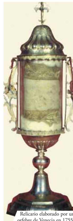
Relicario elaborado por un orfebre de Venecia en 1755