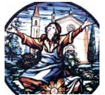
Iglesia de Gruario. Vitral con la representación del Milagro