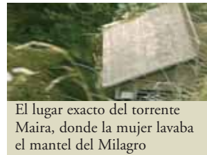
El lugar exacto del torrente Maira, donde la mujer lavaba el mantel del Milagro