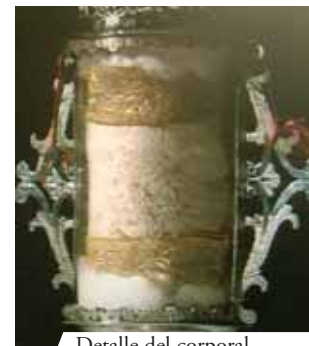
Detalle del corporal