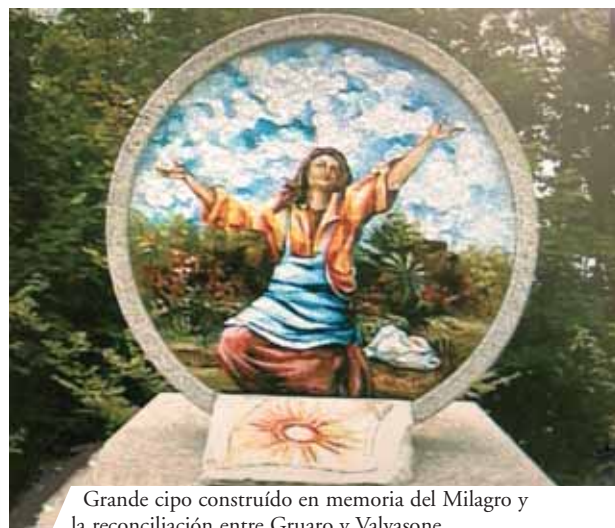
Grande cipo construido en memoria del Milagro y la reconciliación entre Gruario y Valvasone