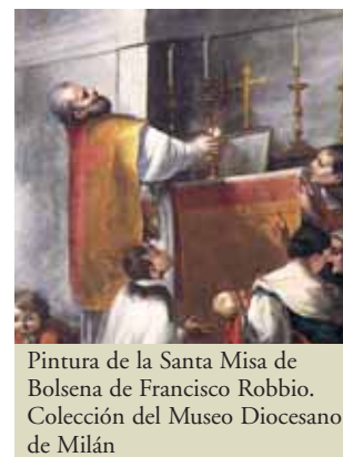
Pintura de la Santa Misa de Bolsena de Francisco Robbio. Colección del Museo Diocesano de Milán