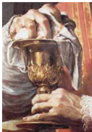
Francisco Trevisani. El Milagro de Bolsena, detalle