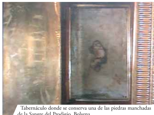
Tabernáculo donde se conserva una de las piedras manchadas de la Sangre del Prodigio, Bolsena