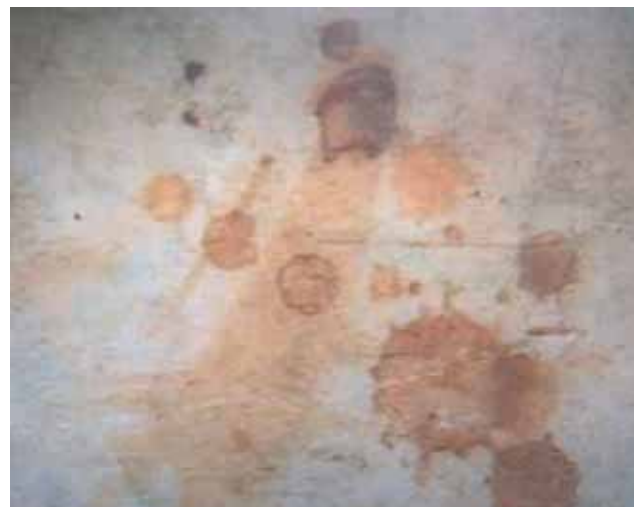
Detalle de la piedra manchada de Sangre, Bolsena