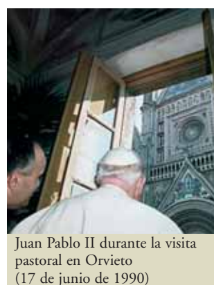
Juan Pablo II durante la visita pastoral en Orvieto (17 de junio de 1990)