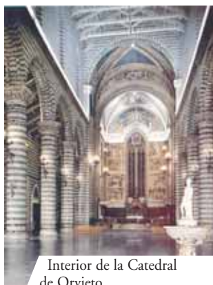
Interior de la Catedral de Orvieto