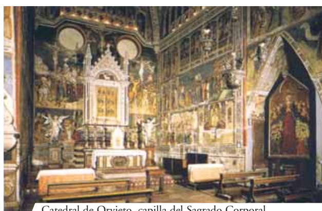
Catedral de Orvieto, capilla del Sagrado Corporal