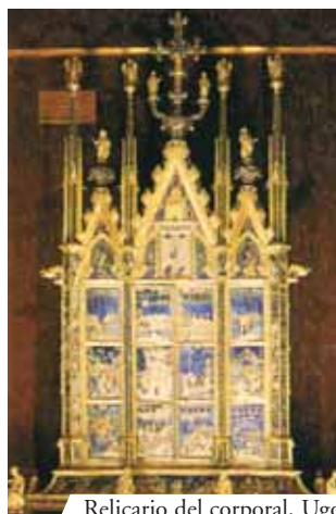
Relicario del corporal, Ugolino de Vieri (1338), Orvieto