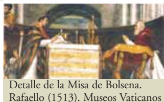
Detalle de la Misa de Bolsena. Raffaello (1513). Museos Vaticanos