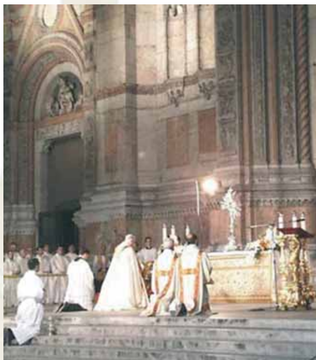
Adoración pública en honor a la fiesta del Corpus Domini, Orvieto