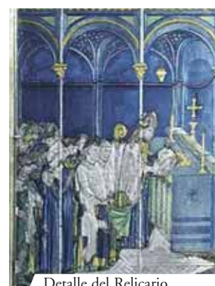
Detalle del Relicario