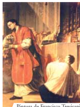
Pintura de Francisco Trevisani