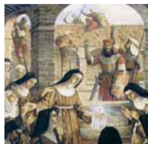
Representación antigua del Milagro de Santa Clara