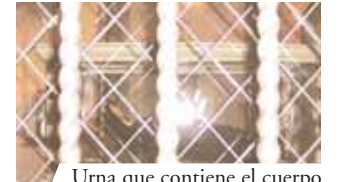
Urna que contiene el cuerpo de Santa Clara, Asís