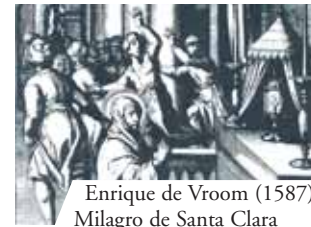
Enrique de Vroom (1587). Milagro de Santa Clara