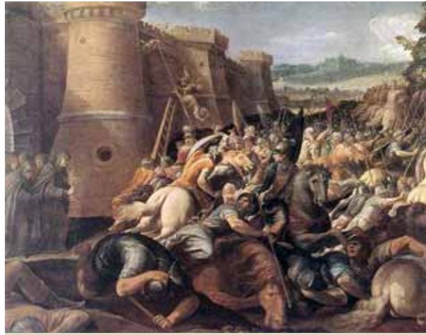
Santa Clara y el asedio de Asís. Giuseppe Cesari (1568 – 1640). Museo Hermitage, San Petersburgo

En la Leyenda de Santa Clara Virgen se narran muchos milagros obrados por esta santa. Cuentan episodios como la multiplicación del pan y las botellas de aceite que aparecen cuando en el convento no quedaba ya ninguna. Pero el más famoso entre todos los milagros obrados por ella es el que ocurrió en 1240, un viernes del mes de septiembre. Clara se encontraba frente a la amenaza de los soldados sarracenos que habían logrado penetrar el claustro del convento de San Damiano. Logró que éstos huyeran mostrándoles la Hostia Santa.