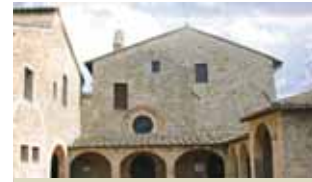
Convento de San Damiano en Asís