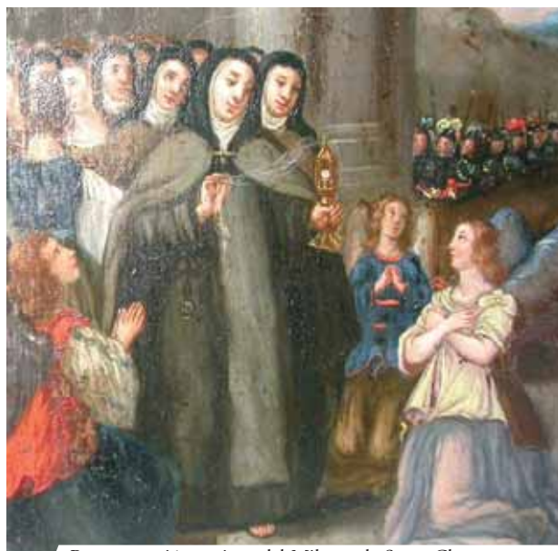
Representación antigua del Milagro de Santa Clara