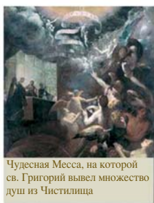
Чудесная Месса, на которой св. Григорий вывел множество душ из Чистилища