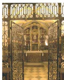
Часовня в Андексе, где находится ковчег