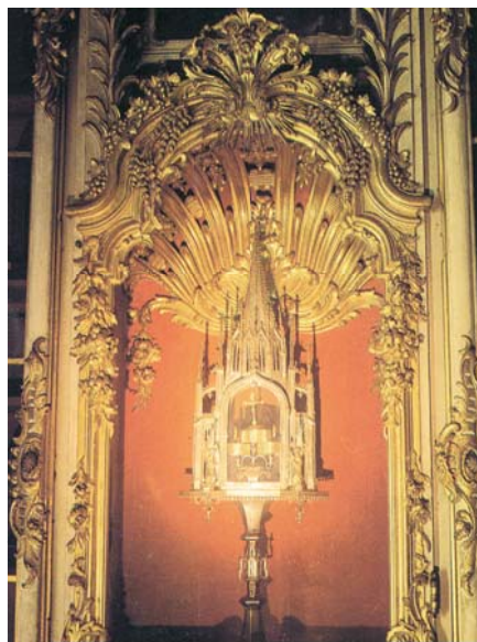
Ковчег с чудесным Хлебом, хранящийся до наших дней в Андексе