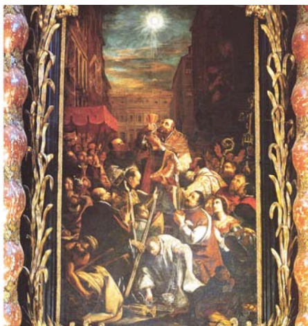
В базилике Corpus Domini в Турине, над алтарем напротив входа, можно увидеть картину Бартоломео Гаравалья, ученика Гверчино, на которой изображено евхаристическое чудо 1453 года.

В базилике Corpus Domini в Турине есть железное ограждение вокруг того места, где в 1453 году в этом городе совершилось первое евхаристическое чудо. Надпись на полу внутри ограды гласит: «Здесь пал наземь мул, несущий Тело Божье – здесь Пресвятая Гостия освободилась из заточения в суму и поднялась ввысь – здесь она милосердно снизошла в воздетые руки туринцев – здесь это место, освященное чудом – помня об этом, преклони колени и молись, в благоговении или в страхе (6 июня 1453 года)».