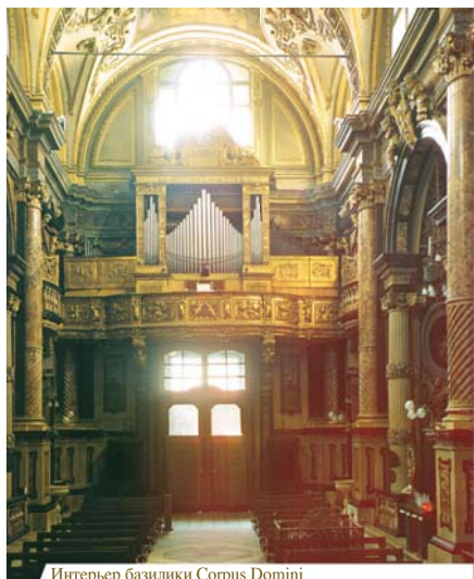
Интерьер базилики Corpus Domini