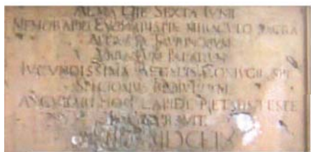
Памятная табличка с описанием чуда в Турине