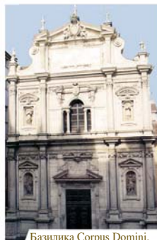
Базилика Corpus Domini, Турин