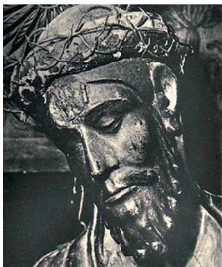
Лик деревянной статуи Иисуса, в которой хранилась чудесная Гостия

В 887 году граф Вифредо основал монастырь в Каталонии, в окрестностях Пиренеев. Вскоре вокруг монастыря, который называют San Juan de las Abadesas («Святой Иоанн Аббатис»), выросла деревня. В монастыре с 1251 года до наших дней хранится распятие с невредимой Гостией, которую нашли замурованной во лбу деревянной скульптуры Иисуса.