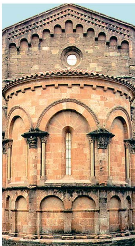
Монастырь San Juan de las Abadesas