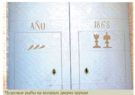
Чудесные рыбы на входных дверях церкви