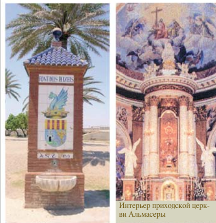
Интерьер приходской церкви Альмасеры