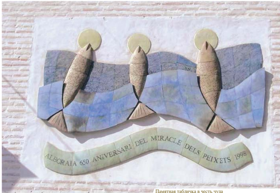
Памятная табличка в честь чуда

Какова же была его радость, когда он увидел трех чудесных рыб, которые почти полностью высунулись из воды и держали во рту, словно маленькие трофеи, невероятные Гости.