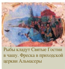
Рыбы кладут Святые Гости в чашу. Фреска в приходской церкви Альмасеры