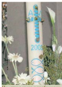
Памятная свеча с изображением рыб, Альборайя-Альмасера