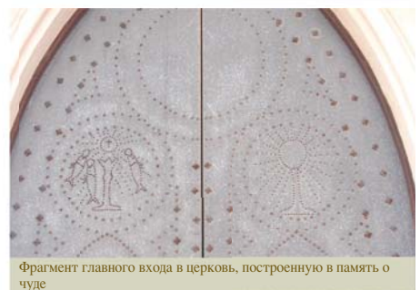
Фрагмент главного входа в церковь, построенную в память о чуде