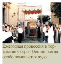
Ежегодная процессия в торжество Corpus Domini, когда особо поминается чудо