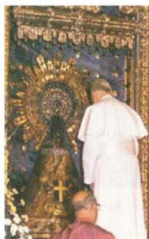
Иоанн Павел II перед статуей Пресвятой Девы Del Pilar, Сарагоса