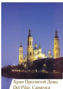
Храм Пресвятой Девы Del Pilar, Сарагоса