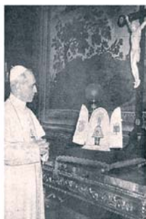
Папа Пий XII перед статуей Пресвятой Девы Del Pilar, преподнесенной ему в дар