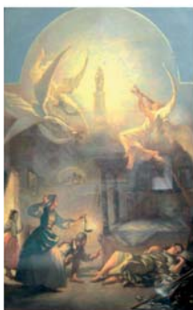
Старинная картина с изображением чуда храма Del Pilar