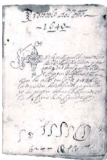
Заверенное нотариусом Мигелем Андре свидетельство о чуде в Каланде (2 апреля 1640 года)