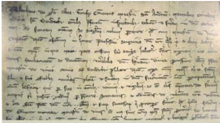
Письмо от 1 марта 1278 года, в котором Альберт, аббат бенедиктинского монастыря св. Андрея в Мантуе, подтверждает, что Святейшая Кровь Иисуса, хранящаяся в монастыре в Вайнгартене, доставлена из Мантуи

Ежегодно в честь святыни в Вайнгартене проходит церемония, известная как Кавалькада Крови.