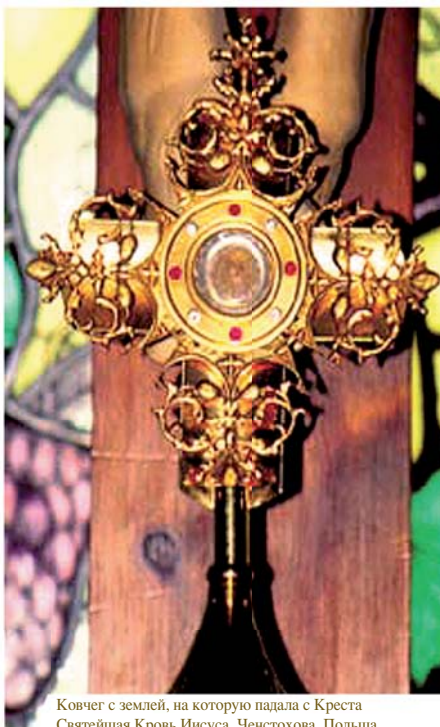
Ковчег с землей, на которую падала с Креста Святейшая Кровь Иисуса. Ченстохова, Польша