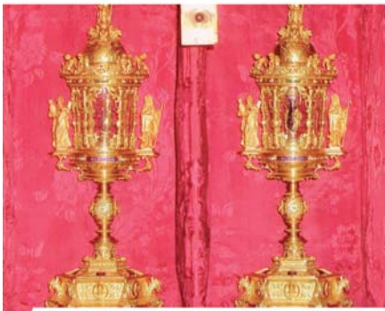
Святейшая Кровь, Мантуя