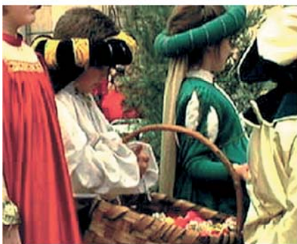
Процессия в честь Святейшей Крови в Мантуе