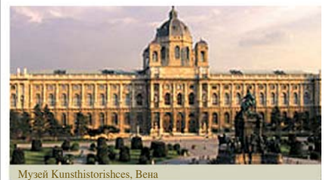
Музей Kunsthistorisches, Вена