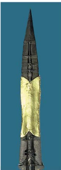
Святое Копье, которым римский солдат пронзил бок Иисуса. Музей Kunsthistorisches, Вена