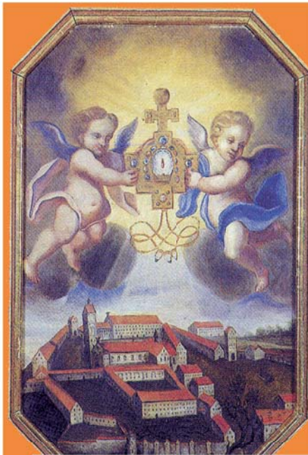
Святейшая Кровь (изображение XVII века). Муниципалитет Вайнгартена