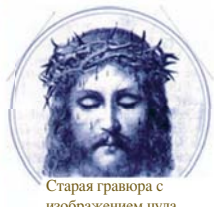
Старая гравюра с изображением чуда