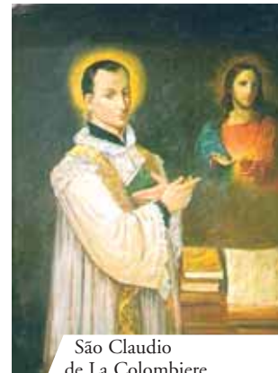
São Claudio de La Colombiere