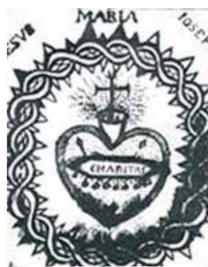
Desenho de Santa Margarida