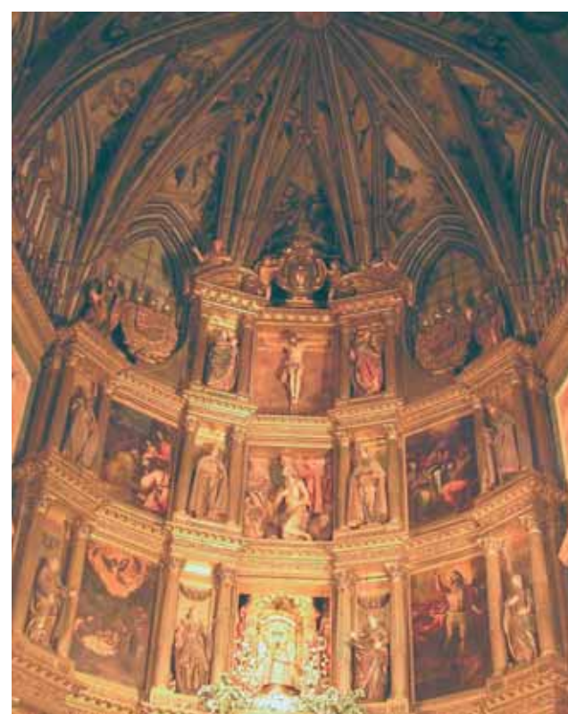
Retábulo de Nossa Senhora de Guadalupe