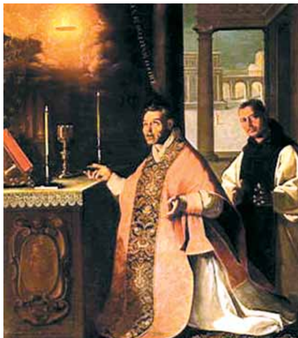
Francisco de Zubarrán, imagem do Milagre

Durante a celebração da Missa, um sacerdote viu muitas gotas de Sangue cair da Hóstia consagrada. O Milagre reforçou a fé do sacerdote e de muitos fiéis, entre eles o rei de Castilha. Os documentos que atestam o Milagre são muitos e as Relíquias do Prodígio foram expostas para a veneração dos fiéis durante o Congresso Eucarístico de Toledo em 1926 e ainda hoje são objeto de profunda devoção de todo o povo espanhol.