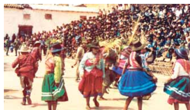
Festividades do Divino Menino