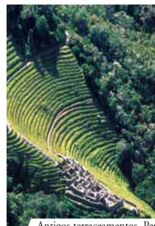
Antigos terraceamentos, Perú