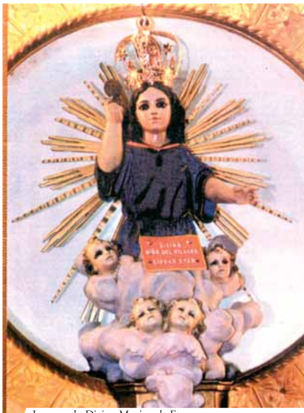
Imagem do Divino Menino de Eten

Todos os anos, a festa em comemoração desse acontecimento começa no dia 12 de julho com a trasladação da imagem do Menino Milagroso do seu Santuário ao Templo da Cidade de Eten e termina no dia 24 de julho.