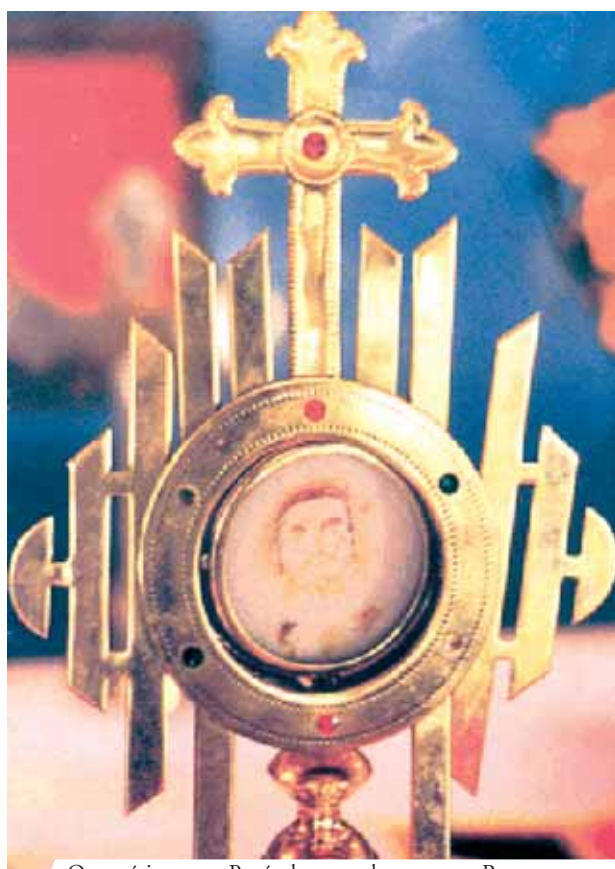
Ostensório com a Partícula na qual apareceu o Rosto