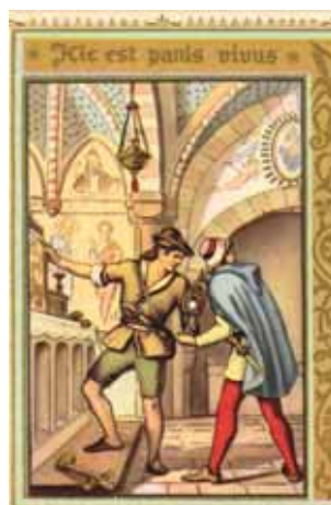
Imagens do Milagre de Turim.