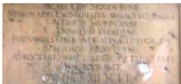
Lápide comemorativa do Milagre, Turim.