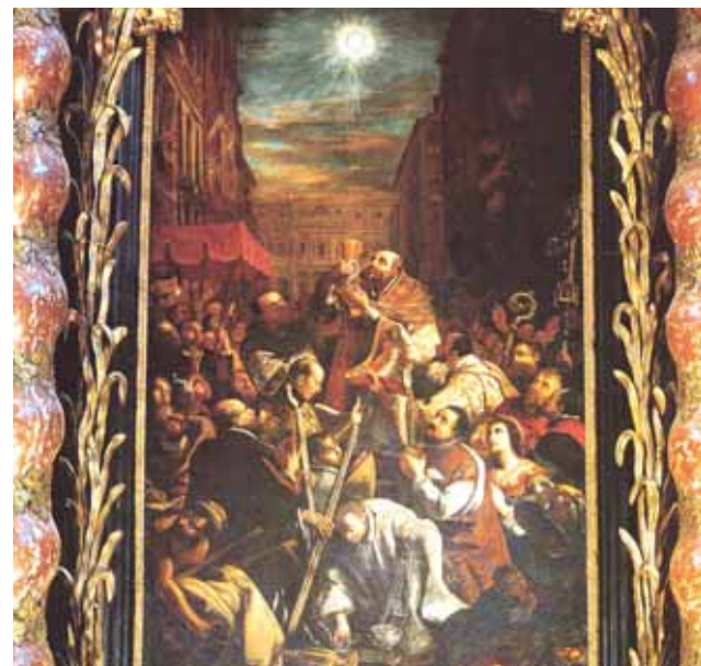
Entrando na Basílica do Corpus Domini em Turim, vê-se claramente sobre o altar um quadro, do pintor Bartolomeo Garavaglia, discípulo do grande Guercino. Este quadro mostra o grande Milagre Eucarístico de 1453.