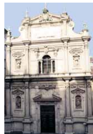
Basílica do Corpus Christi, Turim