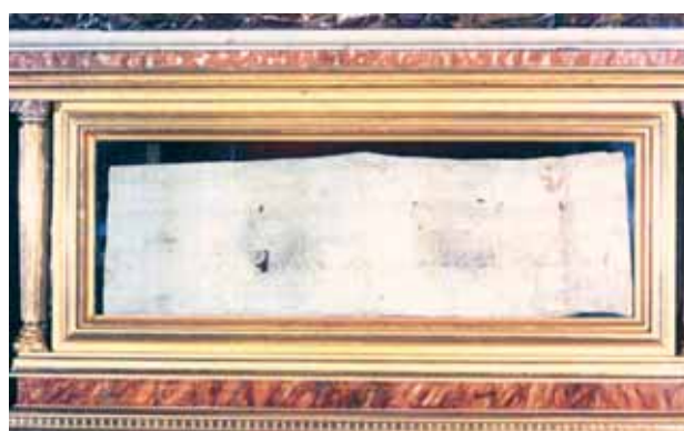
Relíquia do Corporal Ensanguentado