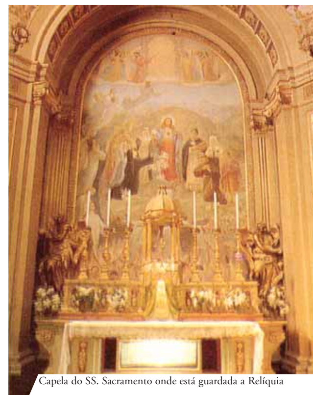
Capela do SS. Sacramento onde está guardada a Relíquia

Em 1494 foi instituída em Macerata uma das primeiras Irmandades em honra do SS. Sacramento (1494) e foi aqui mesmo que nasceu a devota prática das Quarenta Horas no ano de 1556. Todos os anos por ocasião da festa do Corpo de Deus, o corporal do Milagre é levado em procissão atrás do SS. Sacramento.