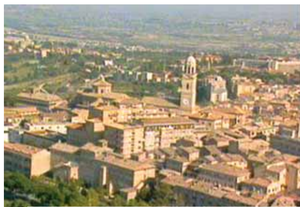
Vista de Macerata