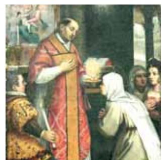
Frequentemente Santa Catarina via escondido nas mãos do Sacerdote, um menino no lugar da Hóstia, ou uma fornalha ardente, na qual lhe parecia que o Sacerdote entrava, no momento da Comunhão. Pintura da colecção do Museu Hiéron de Paray-le-Monial

Jesus confiou a Santa Catarina as seguintes palavras a propósito da Eucaristia: «Vós recebeis toda a essência divina naquele dulcíssimo Sacramento, sob a brancura do pão. E como o sol não se pode dividir, assim o todo, Deus e homem não se pode dividir nessa brancura da Hóstia. Suponhamos que se dividia a Hóstia: mesmo se fosse possível fazerem-se milhares de pedacinhos, em cada um está Cristo, todo Deus e todo homem. Assim como se despedaça um espelho, mas não se despedaça a imagem que se vê, assim, dividindo esta Hóstia, não se divide nem Deus nem o homem, pois em cada uma das partes está o todo. E não diminui em si mesmo, como sucede com o fogo, conforme o seguinte exemplo: se tu tivesses uma chama e a partir dela, todo o mundo viesse acender-se a essa chama, essa não viria a diminuir, e contudo cada um a