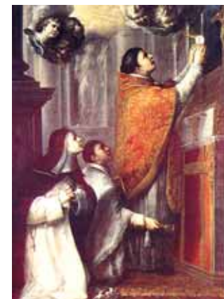
Santa Catarina de Siena vê sair fogo da Hóstia consagrada. Museu Diocesano de Milão