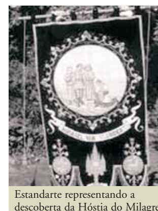
Estandarte representando a descoberta da Hóstia do Milagre