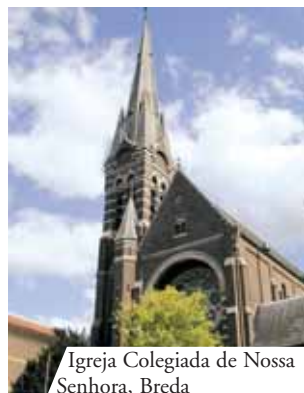
Igreja Colegiada de Nossa Senhora, Breda