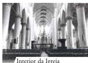
Interior da Igreja