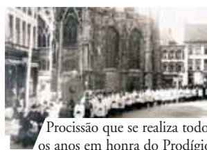
Procissão que se realiza todos os anos em honra do Prodígio