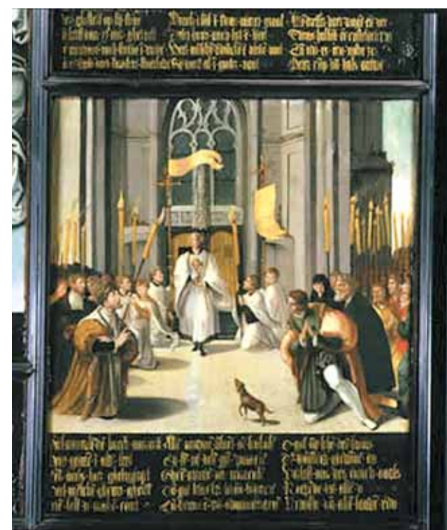
A relíquia da Hóstia do Prodígio é levada em procissão (1535), Museu Sacro de Breda

com este Prodígio Eucarístico. Após vicissitudes alternadas, no século XX o culto foi solenemente restabelecido por uma Confraria de Breda dedicada ao Santíssimo Sacramento. Ainda hoje, a cada ano, durante a festa do Corpo de Deus, se fazem procissões e orações públicas em honra do Prodígio.