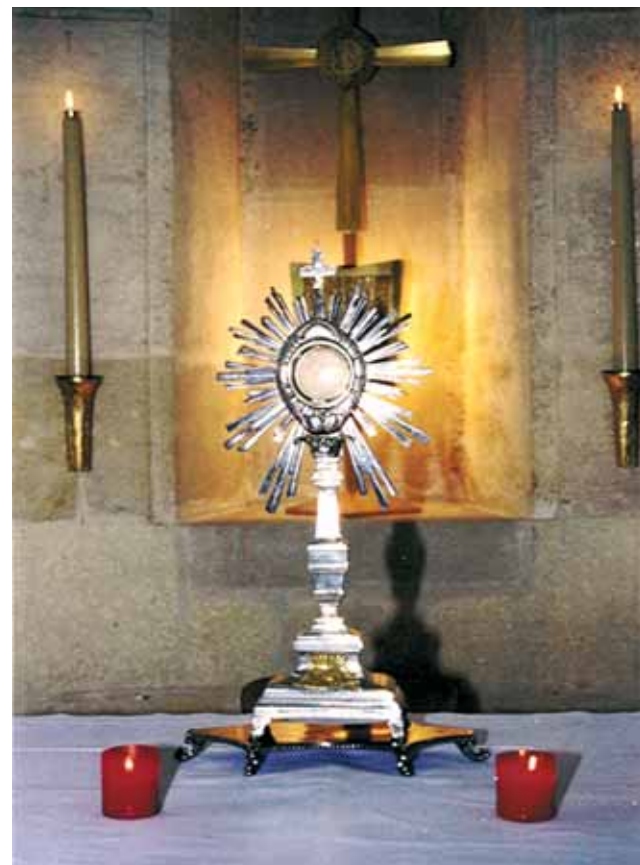
Relicário do Milagre