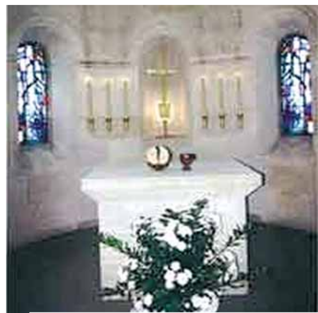
Interior da Igreja «La Solitude». («A Solidão»)