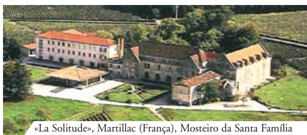
«La Solitude», Martillac (França), Mosteiro da Santa Família