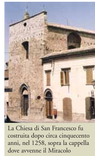
La Chiesa di San Francesco fu costruita dopo circa cinquecento anni, nel 1258, sopra la cappella dove avvenne il Miracolo