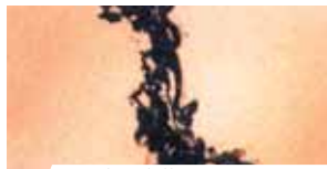
Analisi dell'Ostia. Strutture endocardiche