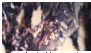
Un lobulo del tessuto adiposo