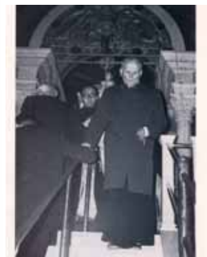
Il Sommo Pontefice Giovanni Paolo II allora Cardinale di Cracovia davanti alle Ss. Reliquie, così esposte in sua invocazione: 3.21.1979