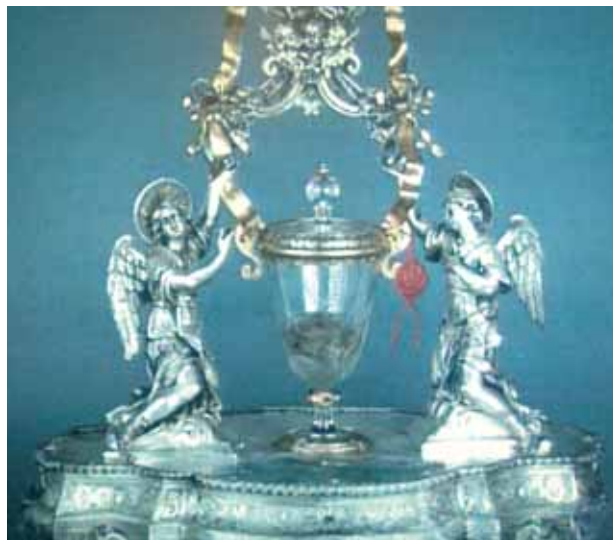
Il reliquiario del XVIII secolo contenente l'Ostia ed il Sangue rappreso, dono del munifico cittadino Domenico Coli.