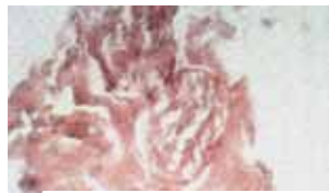
Un nervo vago

«La carne è vera carne umana (costituita da tessuto muscolare del cuore); il sangue è vero sangue (appartenente allo stesso gruppo sanguigno AB della carne); le sostanze componenti sono quelle di tessuti umani, normali, freschi; la conservazione della carne e del sangue, lasciati allo stato naturale per dodici secoli ed esposti all'azione di agenti atmosferici e biologici, rimane un fenomeno straordinario» (Relaz. Linoli 41311971).