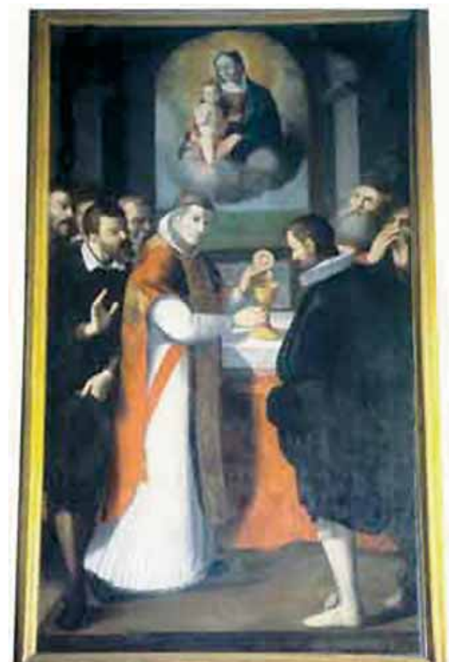
Antico dipinto raffigurante il Miracolo