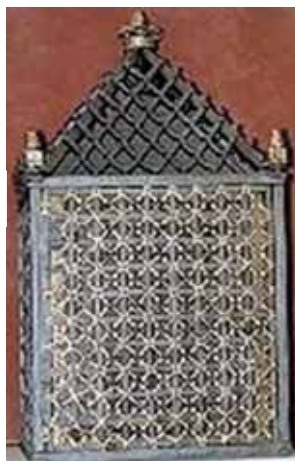
Grata cubica in ferro battuto dorato in cui furono custodite le Reliquie per circa 266 anni.