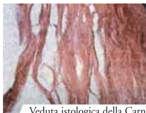
Veduta istologica della Carne

I 5 grumi di Sangue visti con una lente d'ingrandimento. Nel Sangue del Prodigio si riconoscono tutti i componenti presenti nel sangue fresco e miracolo nel miracolo, ciascuno dei 5 grumi di Sangue pesa separatamente 15, 85 grammi, che è l'identico peso dei 5 grumi pesati insieme!