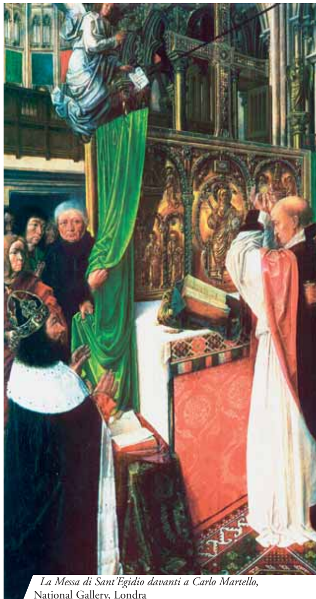
La Messa di Sant'Egidio davanti a Carlo Martello, National Gallery, Londra