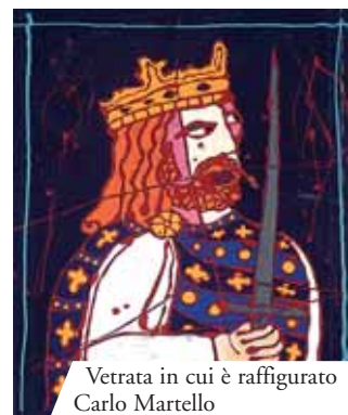
Vetrata in cui è raffigurato Carlo Martello