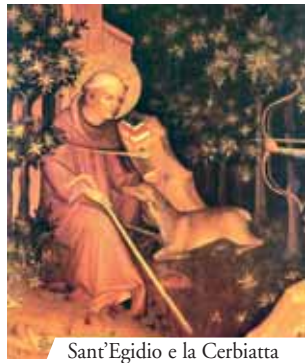
Sant'Egidio e la Cerbiatta

Carlo Martello aveva commesso un grosso peccato e preso dai rimorsi, decise di recarsi in Provenza, al cospetto di un abate molto noto all'epoca che si chiamava Egidio, per chiedergli l'assoluzione di questo peccato, pur senza confessarlo e mantenendo il segreto sul crimine compiuto. Sant'Egidio officiò una Messa allo scopo, quand'ecco che apparve un angelo che si sistemò nei pressi dell'altare con in mano un libro sul quale era scritta la colpa inconfessabile. Mentre la celebrazione procedeva, la scritta sul libro via via si sbiadiva fino a scomparire completamente e Carlo Martello si ritrovò assolto.