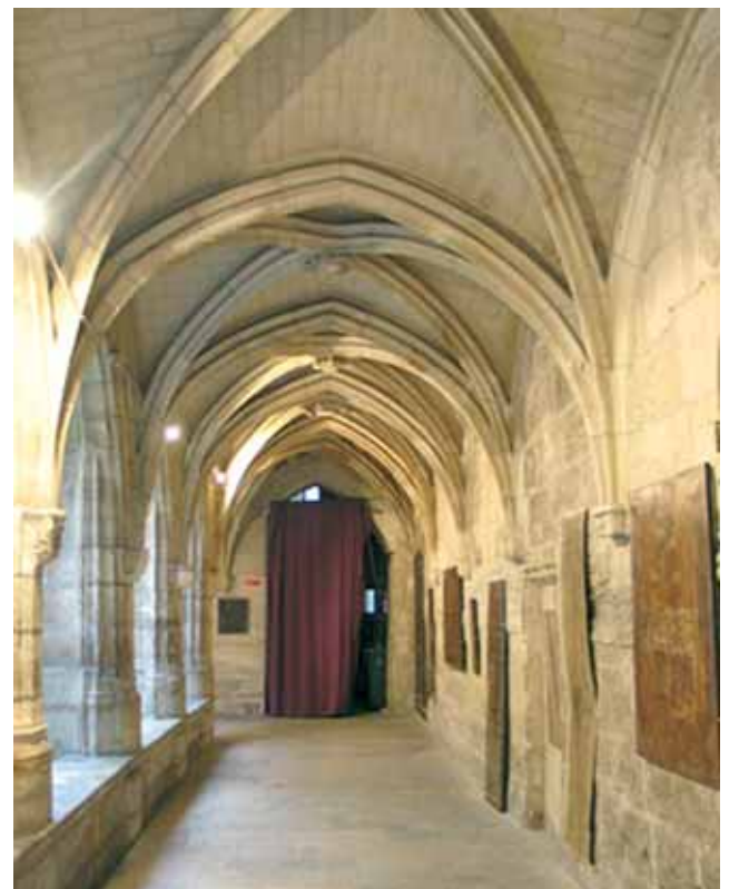
Kreuzgang von Billettes, heute eine Protestantenkirche