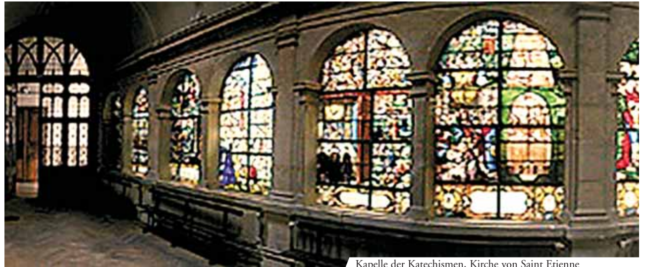
Kapelle der Katechismen, Kirche von Saint Etienne

Dann warf er sie verzweifelt ins kochende Wasser, doch diese erhob sich plötzlich, schwebte in die Luft und nahm die Gestalt eines Kreuzes an.