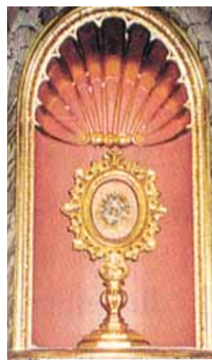
Reliquie des Wunders