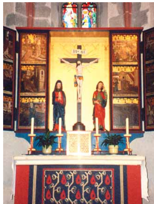
Flügelaltar mit den Phasen des Wunders