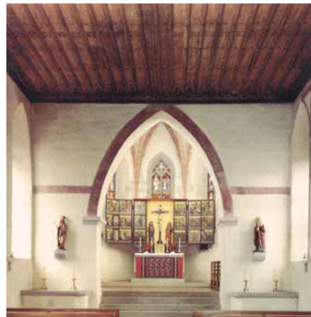
Inneransicht der Wallfahrtskapelle