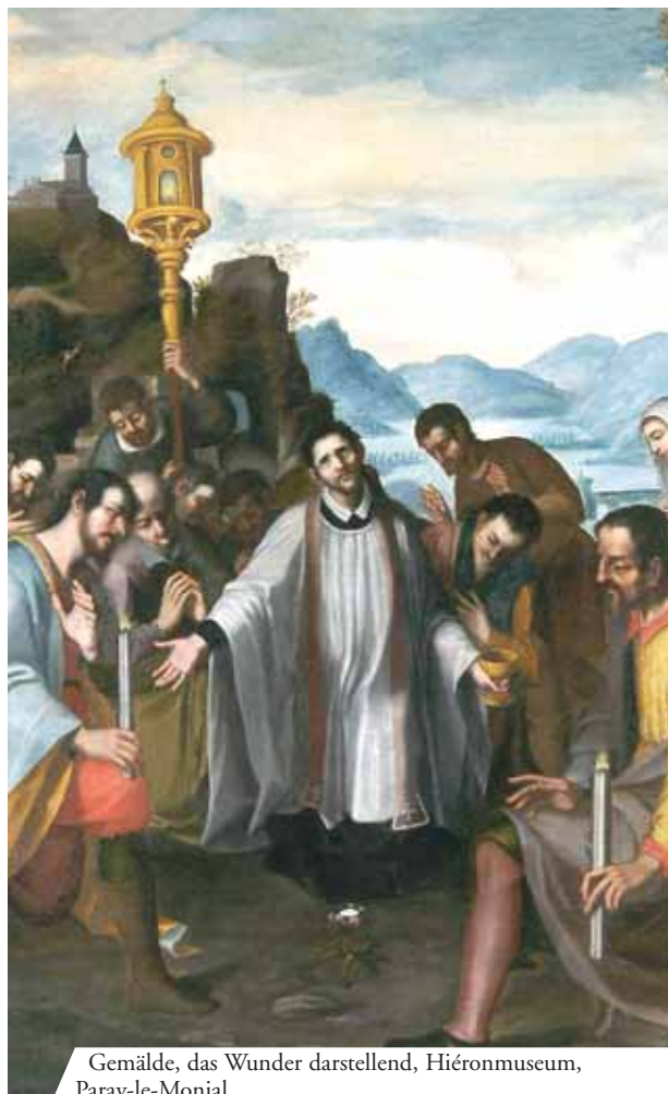
Gemälde, das Wunder darstellend, Hiéronmuseum, Paray-le-Monial