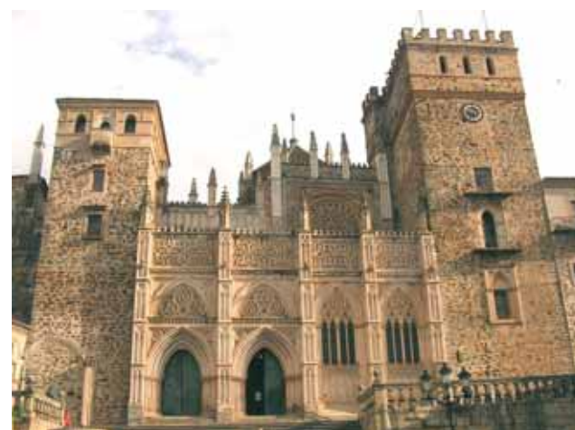
Église Notre-Dame de Guadeloupe