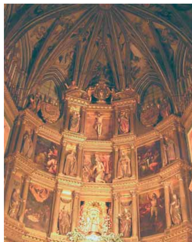
Retable de la Madonne de Guadeloupe