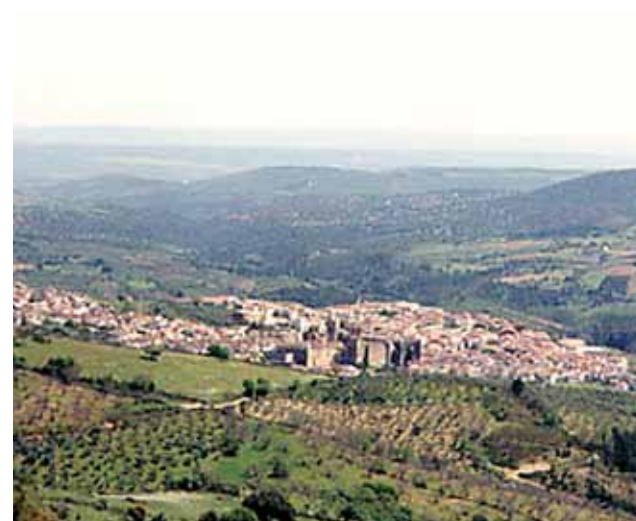
Vue de Guadeloupe