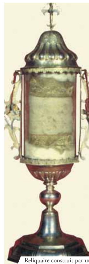
Reliquaire construit par un orfèvre de Venise en 1755