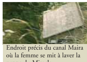
Endroit précis du canal Maira où la femme se mit à laver la nappe du Miracle