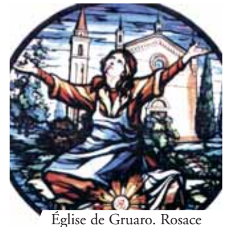
Église de Gruaro. Rosace qui représente le Miracle