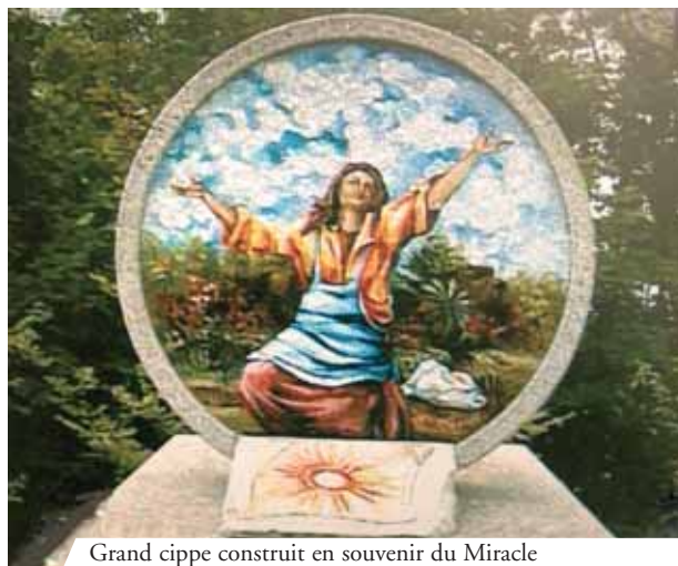
Grand cippe construit en souvenir du Miracle et de la réconciliation entre Gruaro et Valvasone