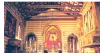
Intérieur de l'église du Très Saint Corps du Christ