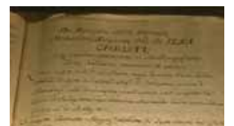
Copie de notaire du rapport rédigé par le Pape Niccolò V de 1454 qui établit que les Comtes de Valvasone avaient le droit de conserver la Relique du Miracle, à condition d'ériger un temple en souvenir du Très Saint Corps du Christ