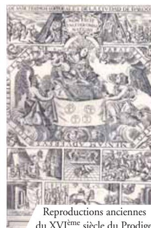
Reproductions anciennes du XVI ème siècle du Prodiges