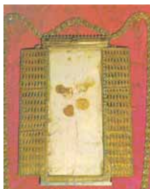
Relique de l'un des deux Corporaux tachés de Sang conservé dans l'église de Daroca

Le Miracle Eucharistique de Daroca se produisit juste avant une des nombreuses batailles des Espagnols contre les Maures. Les commandants chrétiens demandèrent au prêtre du camp de célébrer une Messe, mais quelque minutes après la consécration, une soudaine attaque de l'ennemi obligea le prêtre à interrompre la Messe et à cacher les Hosties consacrées dans les linges en lin de la célébration. Les Espagnols sortirent vainqueurs de la bataille et les commandants demandèrent au prêtre de leur donner la communion avec les Hosties consacrées auparavant. Mais celles-ci furent retrouvées complètement couvertes de Sang. Aujourd'hui encore, on peut vénérer les linges tachés de Sang.