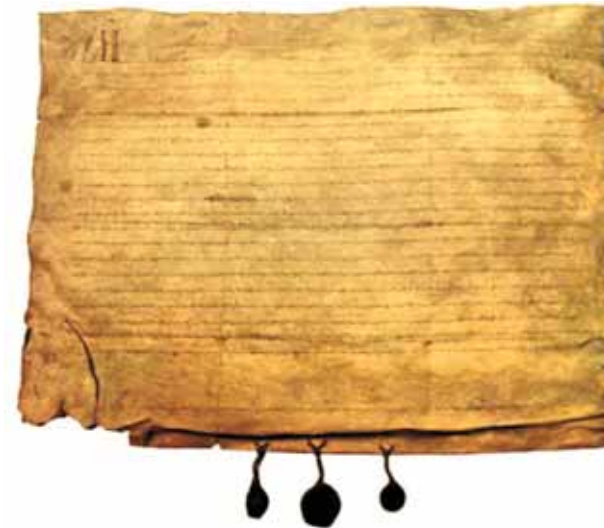
« Carta de Chiva », parchemin conservé dans l'église collégiale décrivant le Prodiges