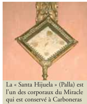
La « Santa Hijuela » (Palla) est l'un des corporaux du Miracle qui est conservé à Carboneras