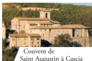
Couvent de Saint Augustin à Cascia

En 1330 à Cascia un paysan gravement malade fit appeler un prêtre pour communier. Le prêtre, par négligence et par apathie, au lieu de prendre avec lui le ciboire avec la Particule destinée au malade, prit une Hostie qu'il enfila sans respect dans son livre de prières. Arrivé chez le paysan, le prêtre ouvrit le livre et vit avec étonnement que l'Hostie s'était transformée en un caillot de sang qui avait taché les pages du livre.