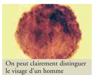
On peut clairement distinguer le visage d'un homme