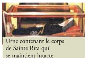
Urne contenant le corps de Sainte Rita qui se maintient intacte