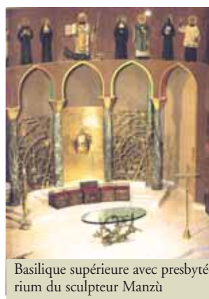
Basilique supérieure avec presbytère du sculpteur Manzù