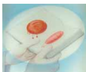
On peut clairement distinguer le visage d'un homme