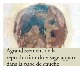
Agrandissement de la reproduction du visage apparu dans la page de gauche