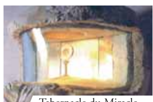
Tabernacle du Miracle Eucharistique