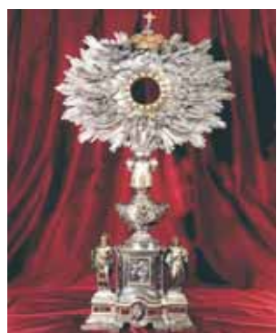
Ancien ostensorio qui contenait la Relique du Miracle