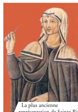
La plus ancienne représentation de Sainte Rita