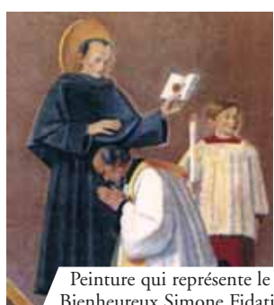
Peinture qui représente le Bienheureux Simone Fidati