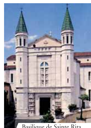
Basilique de Sainte Rita