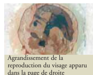
Agrandissement de la reproduction du visage apparu dans la page de droite