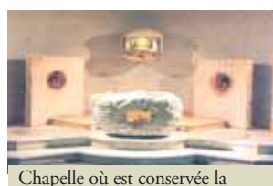
Chapelle où est conservée la Relique dans la Basilique inférieure