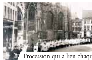
Procession qui a lieu chaque année en l'honneur du Prodiges