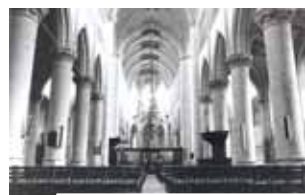
Intérieur de l'église