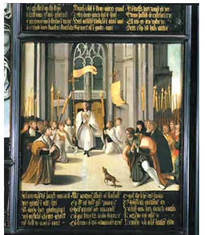
La Relique de l'Hostie du Prodiges est amenée en procession (1535) – Musée Sacré de Breda

plusieurs vicissitudes, au XX ème siècle le culte a été solennellement rétabli par une Confrérie de Breda dédiée au Très Saint Sacrement. Aujourd'hui encore, chaque année, pendant la fête Dieu, ont lieu des processions et des prières publiques en l'honneur du Prodiges.