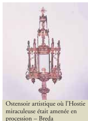
Ostensoir artistique où l'Hostie miraculeuse était amenée en procession – Breda