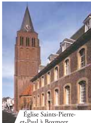
Église Saints-Pierre-et-Paul à Boxmeer

À Boxmeer en Hollande en 1400, le Vin se transforma en Sang et déborda du calice, en se renversant sur le corporal. Le prêtre, terrorisé par cette vue, demanda pardon à Dieu. Le Sang cessa aussitôt de sortir du calice et, tombé sur le corporal, se coagula en une masse grande comme une noix. Aujourd'hui encore il est possible de vénérer la Relique qui n'a subi aucune variation au fil des années.