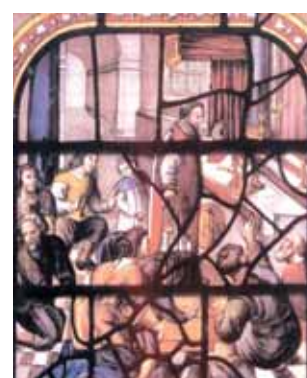
Vitrail à l'intérieur de l'église où est représenté le Prodiges