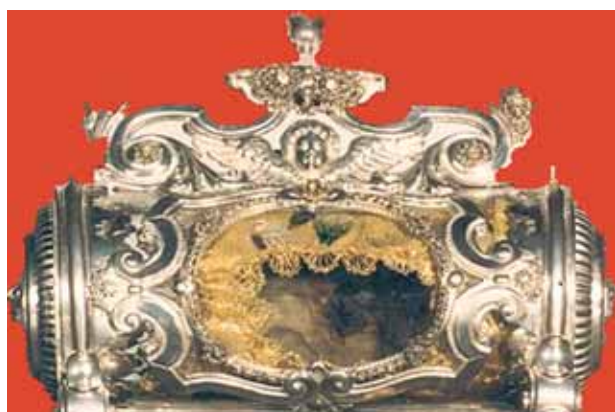
Relique du Sang