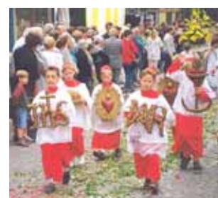
Procession en l'honneur du Prodiges