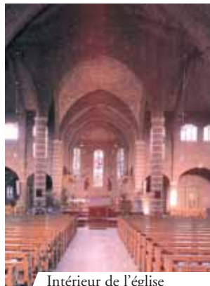
Intérieur de l'église