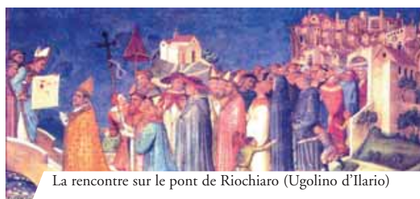
La rencontre sur le pont de Riochiaro (Ugolino d'Ilario)