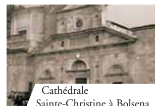
Cathédrale Sainte-Christine à Bolsena