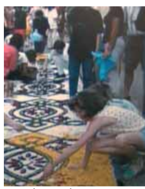
Exposition de fleurs en l'honneur du Miracle