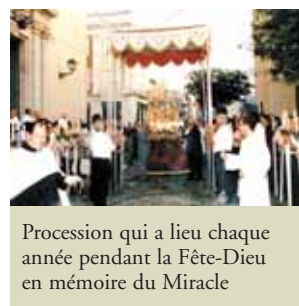
Procession qui a lieu chaque année pendant la Fête-Dieu en mémoire du Miracle