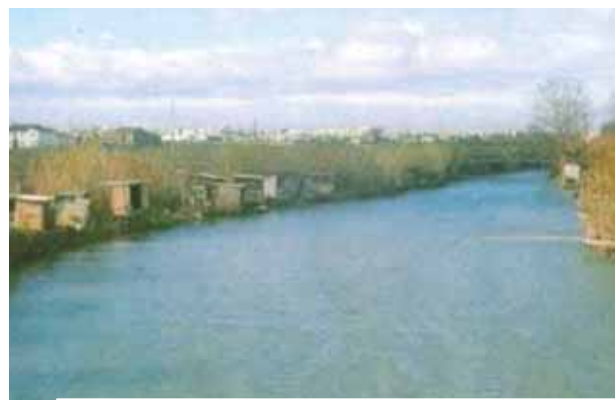
Affluent de la Sierra Calderona traversé par le prêtre