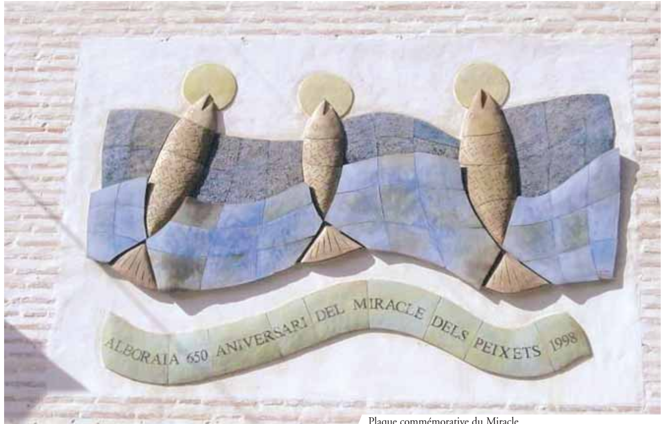
Plaque commémorative du Miracle

Sa joie fut grande quand il vit que les trois poissons prodigieux étaient là, presque complètement sortis de l'eau et soulevaient les Hosties intactes avec leur bouche comme de petits trophées.