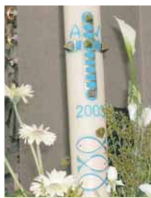
Cierge commémoratif avec les poissons d'Alboraya-Almácer