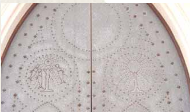
Détail de la porte d'entrée de l'église construite en souvenir du Miracle