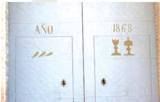
Les poissons du Miracle sont représentés sur la porte d'entrée de l'église