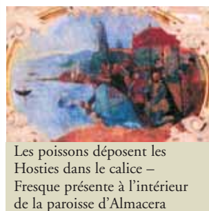
Les poissons déposent les Hosties dans le calice – Fresque présente à l'intérieur de la paroisse d'Almácer