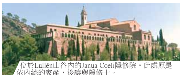
位於Lullén山谷內的Janua Coeli隱修院。此處原是依內絲的家產，後讓與隱修士。